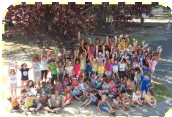
Les enfants de l'Angelmière et l'équipe d'animation