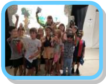
Cabaret à Forges