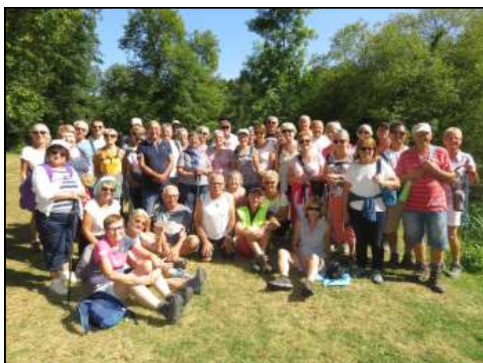
LES 57 MARCHEURS