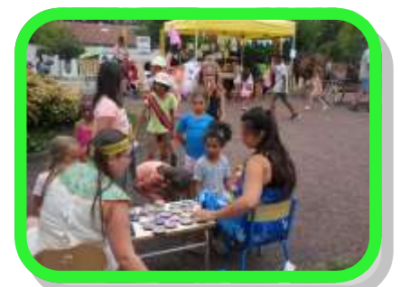
Fête à l'Angelmière