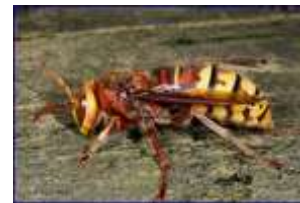
Le frelon Européen— Vespa crabro

Taille adulte : Reine : 27-39 mm Ouvrière : 19-30 mm Mâle : 21-31 mm