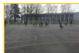
Intervention Jeux sportifs