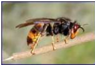
Le frelon Asiatique - Vespa velutina

Pour en savoir plus, nous vous invitons à consulter le site de l'Abeille Vendéenne .